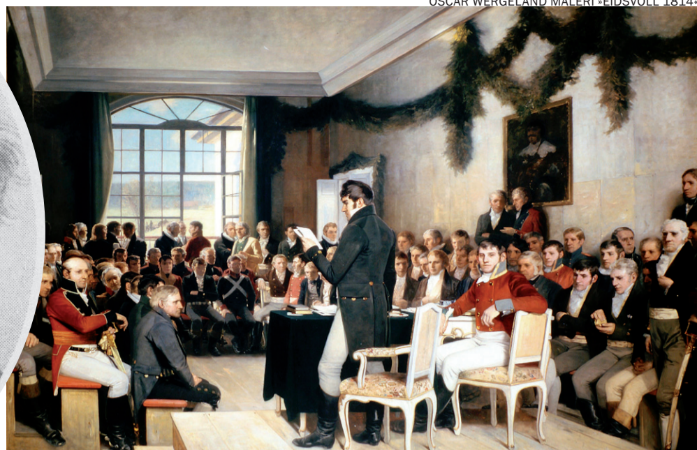
J.F.W. Schlegel havde stor indflydelse, da Eidsvollmændene i 1814 skrev Norges forfatning.

Systemskifte 1814 og 1849. Juraprofessor J.F.W. Schlegel (1765-1836) er en temmelig overset skikkelse i dansk og norsk forfatningshistorie. Ny forskning viser hans centrale betydning for den norske Eidsvollforfatning af 1814 og dermed også for den danske grundlov af 1849.